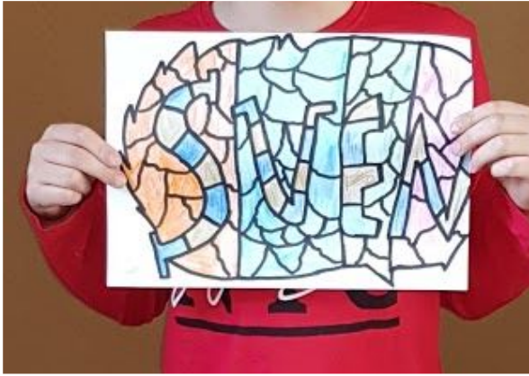
Sven Niks (groep 6) ontwierp zijn eigen naam in graffiti style.